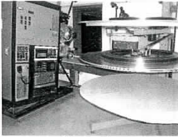
Film en séance