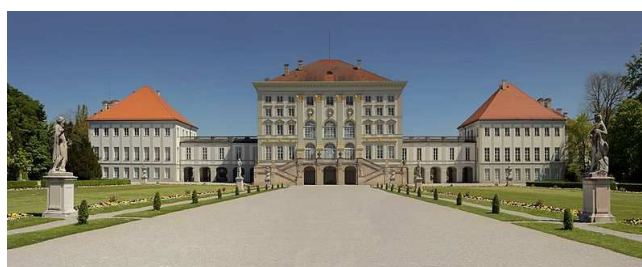
Château du Nymphenburg