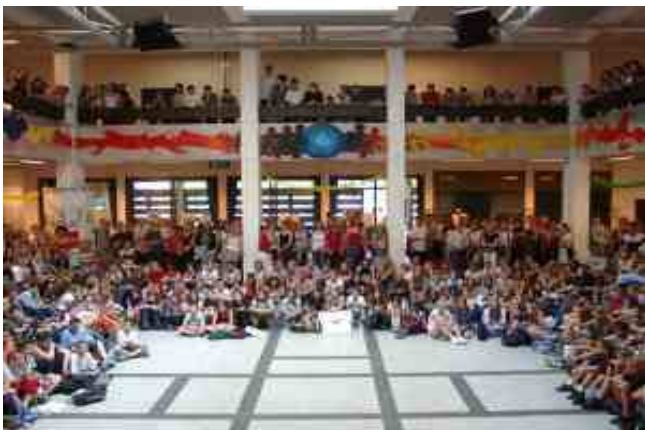
Hall du Dante Gymnasium

Puis le groupe est parti faire une visite guidée, en français, du centre ville, après avoir assisté à deux heures de cours en allemand.