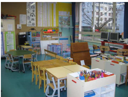
Salle de classe de maternelle à l'école des Petites Roches et livre de contes manouches →

En 2005, l'Education Nationale a décidé que les gens du voyage étaient comme les autres et qu'ils devaient donc être scolarisés comme les autres. L'école sur l'aire de stationnement a donc été rasée (au désagrément des parents) et l'école des Petites Roches a ouvert ses portes aux enfants en 2005. Les parents tsiganes ont été très déçus.