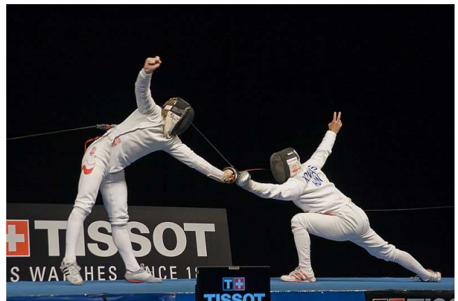
Assaut d'épée aux Championnats d'Europe d'escrime 2007

Pour arbitrer, il faut se mettre à côté de la piste et annoncer le début et la fin du match ainsi que les points. Il y a faute quand une personne touche par terre.