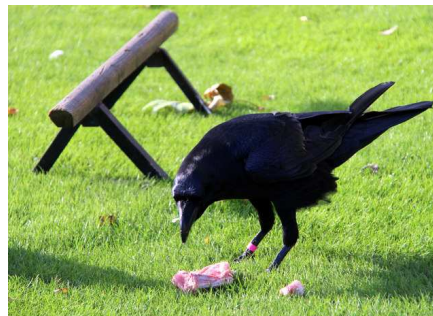
Raven Pens, Tower of London

Ceci n'est qu'un exemple, mais il en existe bien d'autres. Si vous souhaitez en savoir plus, nous vous conseillons de lire les livres suivants : Crazy British Festivals et A Very English Christmas . Bien sûr, les livres et les films Harry Potter ne sont pas à exclure car on y découvre des coutumes anglaises et des pièces de plusieurs collèges très prestigieux d'Angleterre !