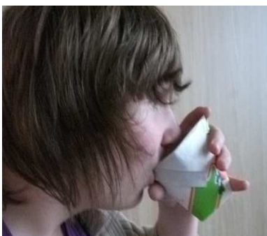
Voici un prototype de l'écoblet®.

Le nom de l'entreprise est MEDPE qui signifie « Mini Entreprise De Pliage Ecologique » .