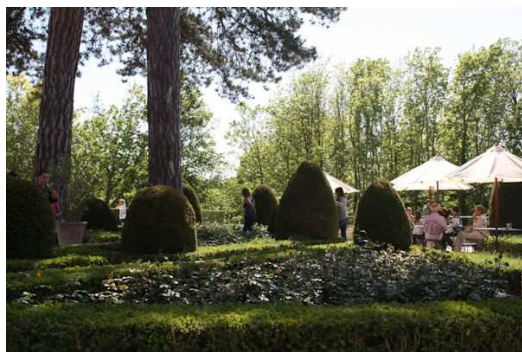
Les jardins avec le restaurant

Le Clos est constitué de jardins ombragés extérieurs, une cour, quelques restaurants de souvenirs et de restauration mais aussi de diverses vérandas intérieures.