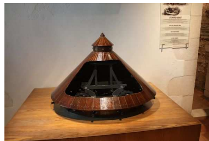
Maquette du char d'assaut

L'ancêtre du vélo, à gauche et l'ancêtre du véhicule automobile, à droite.