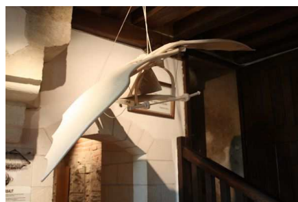
DOUCET Agathe 5°6