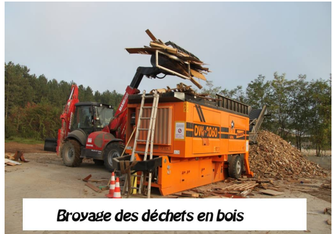
Broyage des déchets en bois

Une fois les objets triés, ils leur redonnent « une seconde vie ». Les vêtements deviennent du métis, les billes de plastique sont revendues à des magasins de