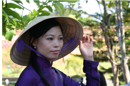
Grace et sourire des vietnamiennes en tenue traditionnelle.